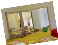
Spiegel in der Turnhalle

Unterstützen Sie uns dabei: Werden Sie Mitglied im Förderverein , unterstützen Sie einzelne Projekte durch zweckgebundene Einzelspenden oder helfen Sie uns mit Ihrer Tatkraft bei KiTa-Veranstaltungen oder bei der Vereinsarbeit – freiwillig, ohne Verpflichtung!