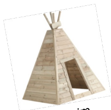
Tipis im Außenbereich

Der gemeinnützige Förderverein unterstützt die Arbeit der KiTa Marienheim dort, wo für besondere Vorhaben die Finanzierung durch den Träger nicht ausreicht. Seit seiner Gründung im Jahr 2007 hat der Förderverein zahlreiche Projekte gefördert – von Spielgeräten für drinnen und draußen über Spiele und Bücher für jede Gruppe bis hin zu Ausflügen und vielem mehr. Doch es gibt auch weiterhin Wünsche, die der Förderverein zum Wohle der Kinder erfüllen möchte.