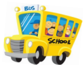
Busausflug der Schulkinder